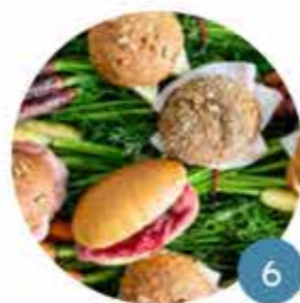
Lunch & Broodjes