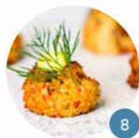
Borrelgarnituren & Hapjes